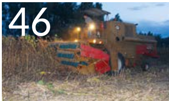
Bizon w słoneczniku

Podczas słonecznikowej trasy żniwnej w ubiegłym sezonie postanowiliśmy zobaczyć, jak sobie radzi ze zbiorem charakterystycznych koszyczków wciąż najpopularniejszy kombajn zbożowy na polskich polach. Z niewielkim areałem tej rośliny zmierzył się blisko 35-letni Bizon Z056 Super.