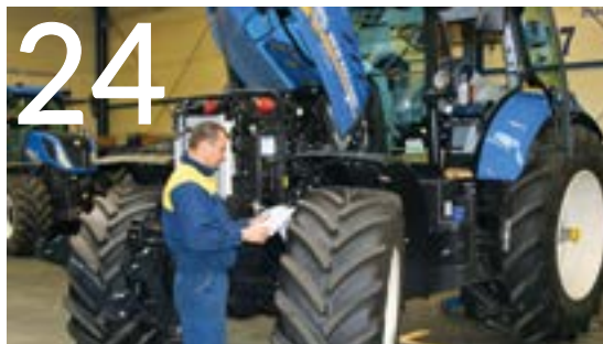
Inspekcja PDI, czyli przegląd zerowy

Zanim nowy ciągnik zostanie dostarczony do rolnika, trafia najpierw z fabryki do dilerów. Tam przed wydaniem go klientowi przeprowadzany jest tzw. przegląd zerowy, czyli inspekcja PDI. To ostatni moment na sprawdzenie traktora pod każdym kątem i ewentualne drobne poprawki.