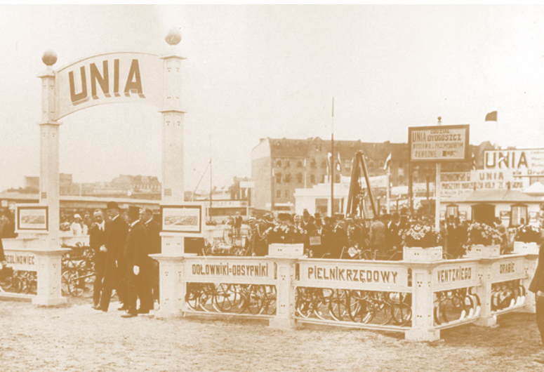
Stoisko marki Unia podczas wystawy rolniczej w 1924 r.